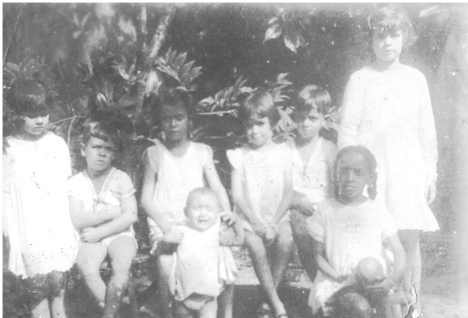
Foto 04 - Crianças de Fernando de Noronha – Sem Identificação - 1930

oferecidas as atividades profissionalizantes. A imagem seguinte foi produzida na década de 1930 e registra a presença das crianças que viviam na Ilha de Fernando de Noronha nas primeiras décadas do século XX.