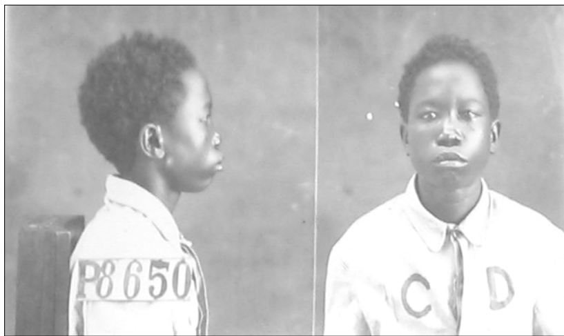
Foto 01 - Esta imagem foi encontrada no acervo da Casa de Detenção. As fotografias faziam parte dos documentos arquivados nos prontuários dos detentos. Fundo: Casa de Detenção do Recife – Apeje

Do Pátio do Carmo à Detenção, da Detenção ao Abrigo de Menores. O breve registro da passagem de Amarelinho pelo presídio estava escondido em meio aos prontuários individuais, pertencentes ao acervo da antiga Casa de Detenção do Recife. Os prontuários reúnem documentos pertinentes à passagem do preso na Casa, contendo informações curtas, objetivas e às vezes telegráficas, tornando o trabalho do historiador que pretende discutir o passado das crianças no cárcere, ainda mais difícil, uma vez que não há registros do cotidiano das crianças na Casa de Detenção nesses documentos.