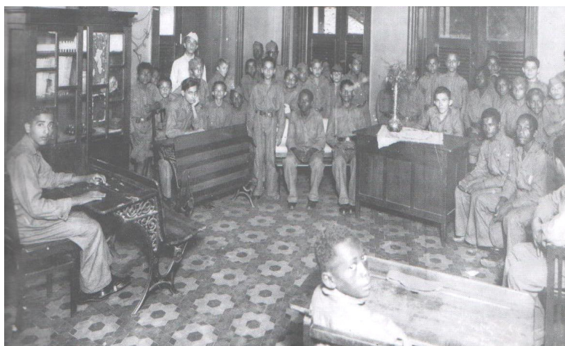
Foto 08 - Crianças internas no Instituto 5 de Julho. Década de 1930.

Além dos trabalhos agrícolas, os alunos também freqüentavam as aulas de ensino primário. Em uma outra fotografia, encontramos o registro dos meninos em uma sala de aula.