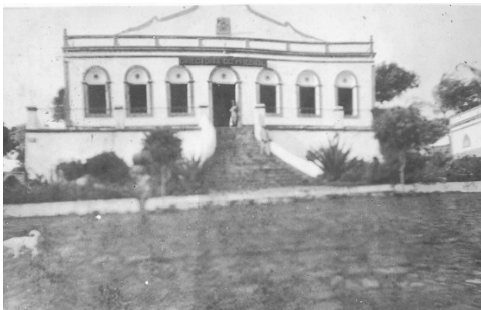
Foto 03 - Sede da Administração do Presídio de Fernando de Noronha - 1930 Prédio construído no século XIX

Existia na Ilha um núcleo urbano, onde as pessoas que trabalhavam na sua administração residiam. Este núcleo era formado por edificações construídas desde o período colonial, como várias fortalezas que foram erguidas para proteger o arquipélago das ameaças de invasões estrangeiras. A sede administrativa do presídio (imagem logo abaixo) localizava-se neste espaço urbano, também chamado de Vila dos Remédios, serviu como cenário onde eram discutidas as várias decisões acerca do cotidiano dos sentenciados. 299