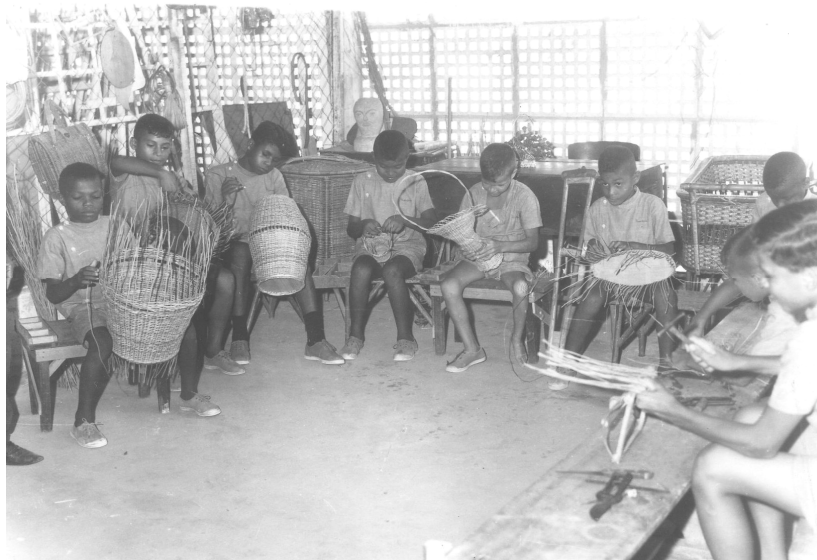
Foto 06 - Crianças internas no Instituto 5 de Julho. Década de 1930. O olhar do fotógrafo captou o sorriso da criança e o registro da satisfação.

No decorrer da nossa pesquisa, encontramos fotografias que abordavam as atividades de ensino profissionalizante que nos levam a discutir a questão da estratégia de controle do Estado sobre as crianças e jovens. O Instituto nasceu a partir do interesse do governo do Estado em criar um espaço para a ressocialização dos meninos através do trabalho. As oficinas de carpintaria e marcenaria, por exemplo, faziam parte das atividades oferecidas pela instituição. A fotografia, a seguir, registra o trabalho na oficina de cestaria dos meninos internos.