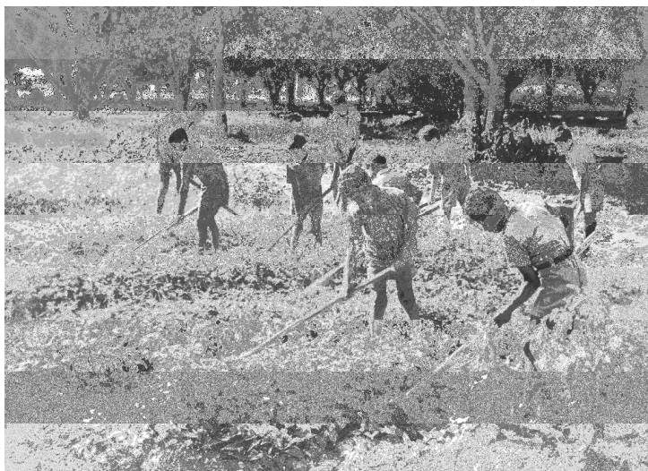
Foto 07 - Crianças trabalhando em atividades agrícolas. Década de 1930.

Durante a inauguração do Clube Agrícola, foi organizada uma seção onde os meninos expuseram as flores que cultivavam no Abrigo. Avencas, begônias, orquídeas e hortências foram comercializadas na Feira Semestral promovida pela Escola Rural Modelo. Segundo a reportagem do Diário da Manhã , a seção dos meninos do Abrigo era uma das mais visitadas e animadas. 327